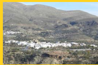
Municipio de Almócita