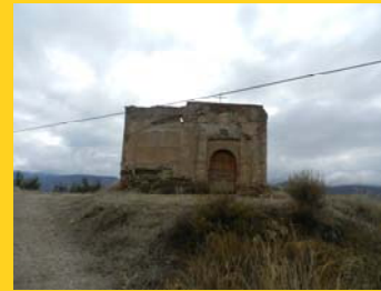
Ermita de los Desamparados