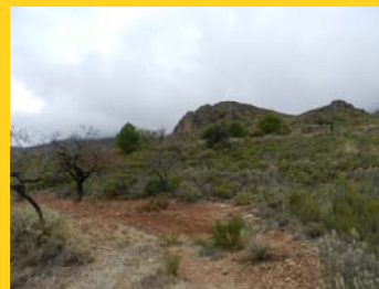
Tajos del Moralico