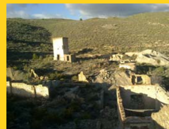
Ruinas Minas de la Solana