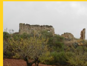
Ruinas Cortijo de las Paces